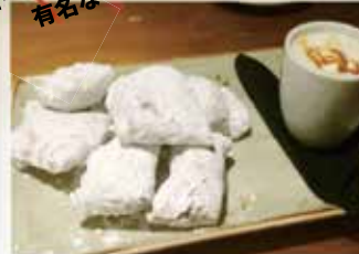
ドーナツ『ベニエ』 (フランス語で揚げた生地)