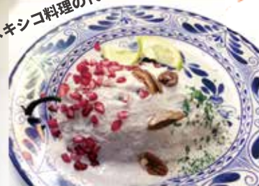
毎年9月15日のメキシコ独立記念日に食べる『チレス・エン・ノガダ』 (またはチレ・エン・ノガダ)