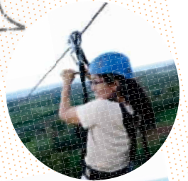
ジップライン Enjoy Zipline In Hawaii