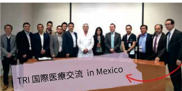
TRI 国際医療交流 in Mexico

ポブラーノというピーマンが大きくなったような、辛みのないチレの中に、豚と牛の合い挽き肉と、フルーツやドライフルーツ、ナッツ、タマネギのみじん切りなどを炒めた具を入れたものに、くるみをつぶして、クリームと和えたソースをかけます。仕上げにザクロの果肉やパセリがちりばめられます。20種類以上の材料を使い、メキシコ料理の中でも最も洗練された料理のひとつとされています。(ただ、くるみのソースとザクロが甘いので、好き嫌いがわかれる料理かもしれません)