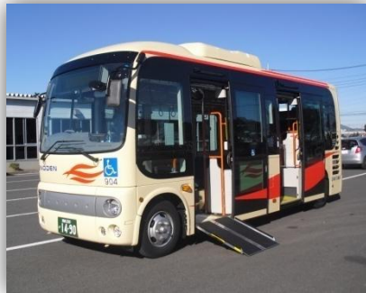
※車椅子でもご乗車いただけます

平成24年3月30日より藤沢駅南口(右下図)より当院への江ノ電バス運行が開始となります。 各停留所を經由し、当院「湘南鎌倉総合病院」にて折り返し藤沢駅までの運行です。藤沢駅よりお越しの方はこちらをご利用ください。