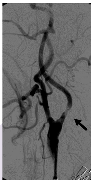
頸動脈造影写真 黒矢印：頸動脈狭窄