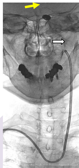
上肢からの脳動脈塞栓術 黄色矢印：コイル 白矢印：カテーテル