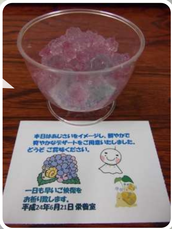
昨年2012年に病院で出されたあじさいゼリー